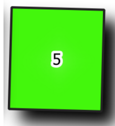
Obr. 2 Ukázka zakreslení volných hrobových míst na mapě hřbitova